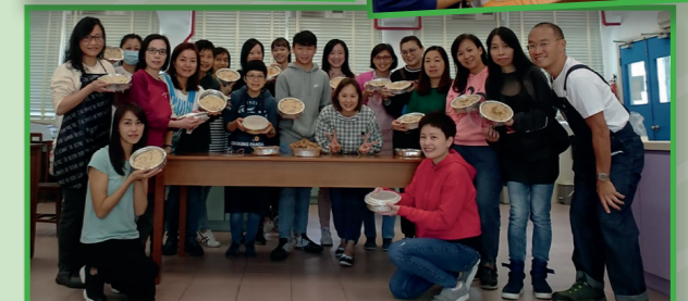
2020年1月18日「家長學堂」舉辦賀年小食製作——芋頭糕班；參與人數：22位家長