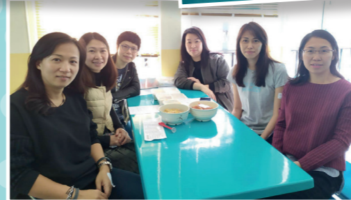
十位家長義工及老師突擊測試飯商食物品質及進行問卷調查