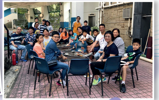
家長校園BBQ 舉辦於2019年11月9日；參與人數：23位家長及學生