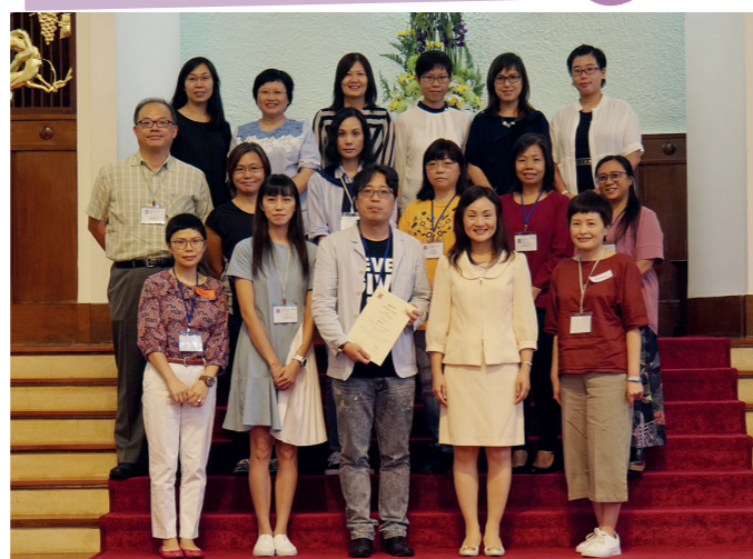
2019年9月28日第20屆家長教師會周年大會