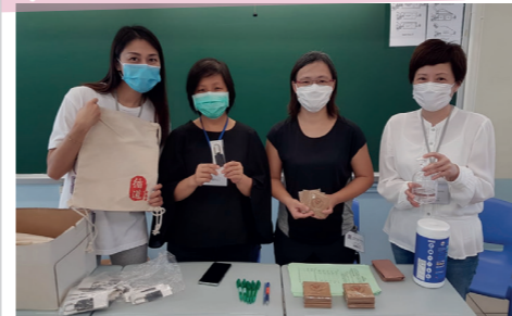
2020年7月9日中一註冊日