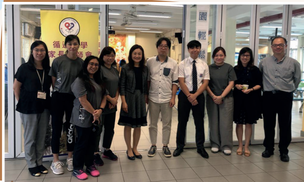
2019年11月2日「校祖日」舉辦校園輕鬆Tea壹Tea；參與人數：20位義工委員