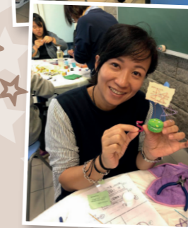
5星星黏土工作坊 - 2020年1月11日；參與人數：22位義工