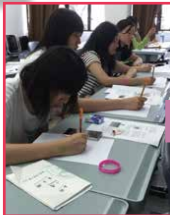
高中同學參與香港文學夏令營，培養創意思維。

中國文學科被視為明日黃花，收生人數每下愈況，學生普遍認為學科課程繁多，以及考試時間冗長，確是令到不少學生卻步。然而，這現象的出現或許是部分人對中國文學科存有誤解，其實修讀中國文學科能讓學生拓寬學習空間，讓學生通過文學的學習，以培養審美情趣，提升藝術品味；提高文學素養，承傳文學遺產；陶冶性情，美化人格；培養對國家民族、人類社會的感情；發展個性，發掘潛能，發揮特長，為日後工作和進修作好準備。以上都是修讀文學科獨有的好處。