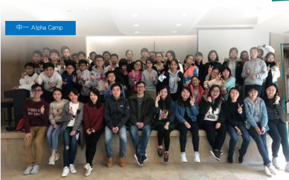
中一 Alpha Camp