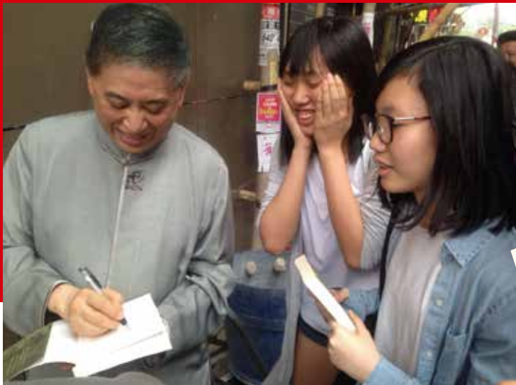
文學班同學出席講座後，喜孜孜地向名作家白先勇教授索取簽名。

為提升同學的語文能力和培養學生的學習興趣，以應付新高中課程，中文科積極開展切合本校學生需要和興趣的校本課程，以多元化的學習活動及互動的模式上課，讓學生成為主動的學習者。教學以啟發誘導為主，課堂創設高參與情境，讓學生經歷其中，並通過小組協作，互相補足，照顧差異，做到廣議博思，切磋砥礪之效。