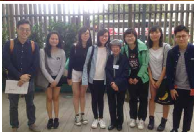
中國文學科老師及一眾學生與盧瑋鑾教授 (小思老師) (右四) 拍照留念。