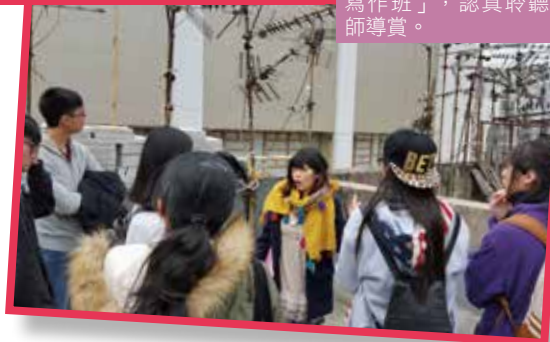
文學班同學參與「地景寫作班」，認真聆聽導師導賞。