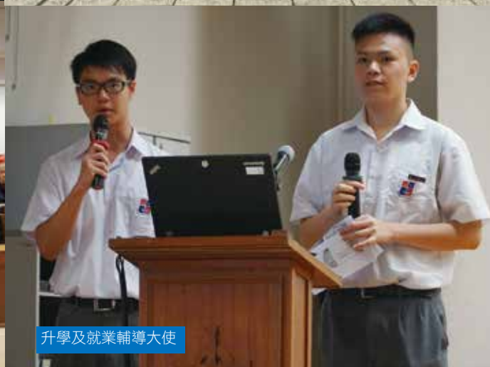
升學及就業輔導大使