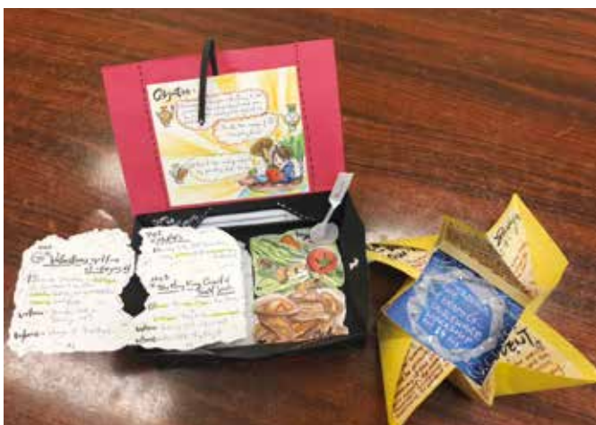
F.5 students_ works of making a leaflet to promote a CSR activity