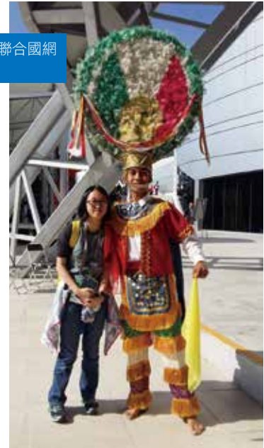
在墨西哥出席「聯合國網絡管治論壇」