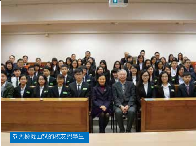
參與模擬面試的校友與學生