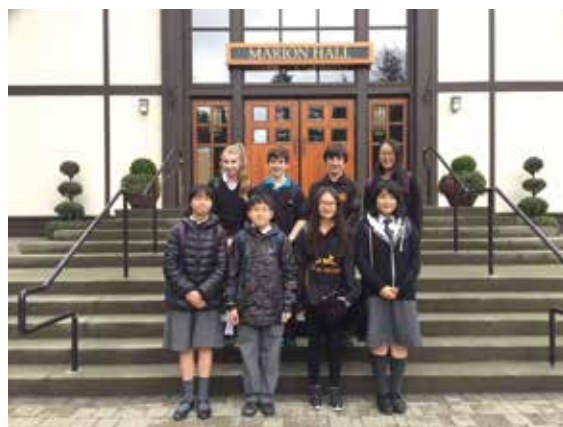
Immersion Programme to Canada with Shawnigan Lake School

本着「讀萬卷書，行萬里路」的精神，本校每年皆為學生安排不同類型的境外及海外交流活動，使學生得以擴闊視野和胸襟。