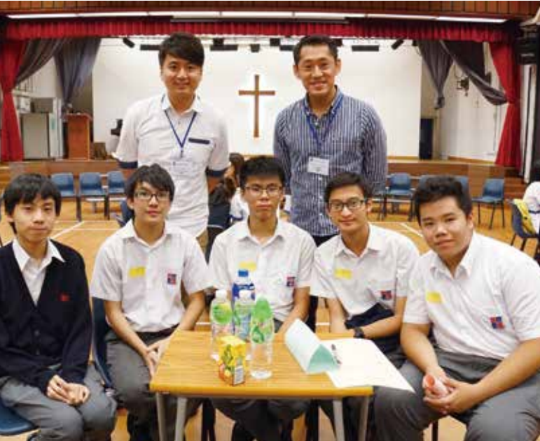
職場參觀：機場管理局