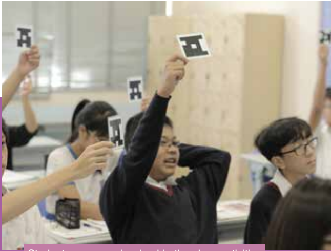
Students are more involved in the class activities when e-learning tools are used.