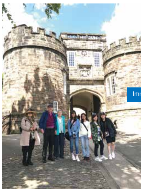
Immersion Programme to UK