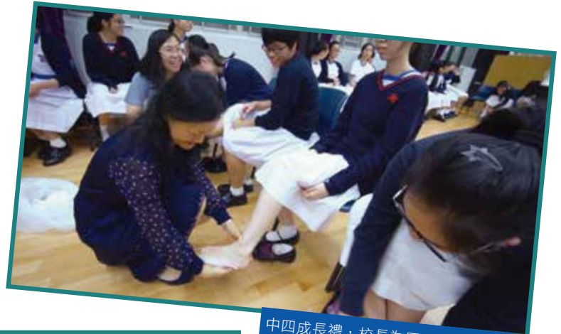
中四成長禮，校長為同學洗腳，實踐僕人領袖的榜樣。

We are here to nurture: Modest, Caring and Knowledgeable Leaders of the New Era