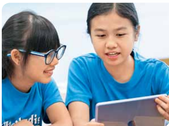
電子教學是教育界的新趨勢。