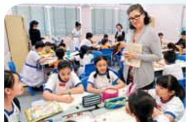
循道學校學生到循道中學體驗英文課。

在SSPA內，有直屬和聯繫關係的中學可保留一定百分比的統一派位學額（直屬最多85%，聯繫最多25%）予相關小學的學生。換言之，其他小學的學生若同時於統一派位階段選擇這些中學，獲取錄的機會將受影響。