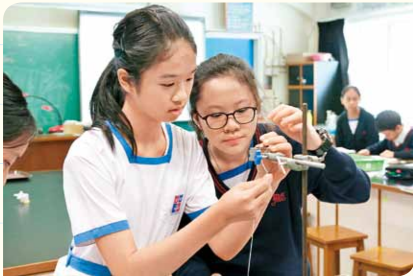
中學科學科重視親手做實驗。

六年的中學教育將進一步塑造子女的雛形，選對合適的中學對其學業以至職業的發展，影響力舉足輕重。適齡升中學童數字有上升趨勢，競爭將更激烈，不論是否擁有直屬學校的保留學位，家長都應深入了解中學學位分配辦法 (SSPA) 的機制，令每一個決定都更有把握，提高子女獲心儀中學取錄的機會。